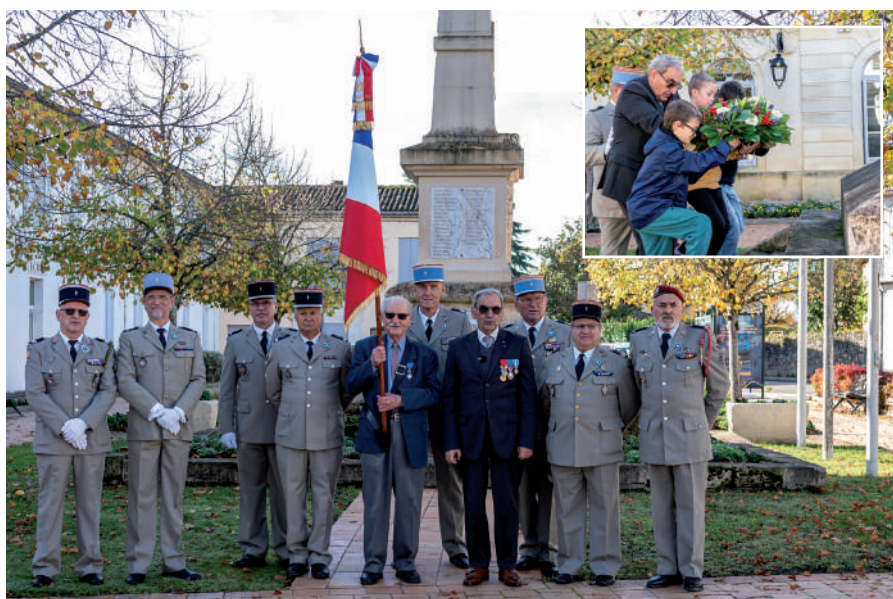
1- Son père André Redon tué en 1916 lors de la plus terrible des batailles : Verdun.