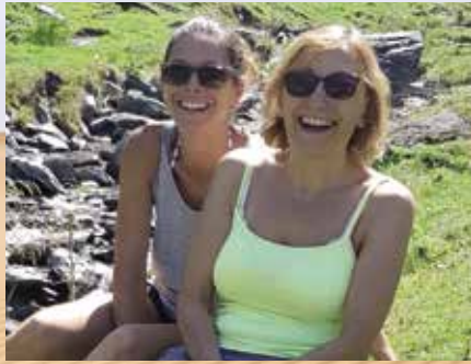
Équipage 276 les Landi'Roses

Ce trophée, en plus de soutenir des associations caritatives comme et surtout Le Ruban Rose (lutte contre le cancer du sein), la Croix Rouge , Les Enfants du Désert , met à l'épreuve des équipages exclusivement féminins en garantissant le dépassement de soi, l'aventure, le partage et la solidarité.