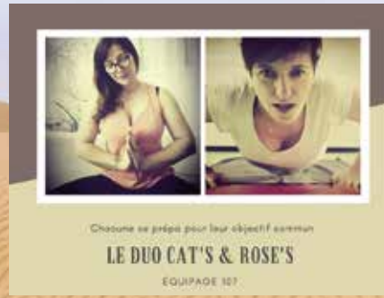
Équipage 107 les Cat's & Rose's

www.facebook.com/Les-LandiRoses-107104981794303