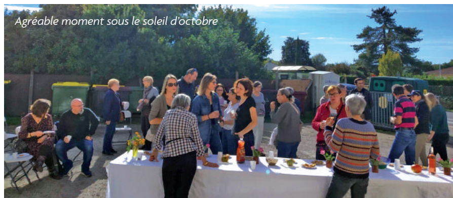
Agréable moment sous le soleil d'octobre

Les associations ont jusqu'au 28 février 2023 pour remettre leur bilan à la mairie