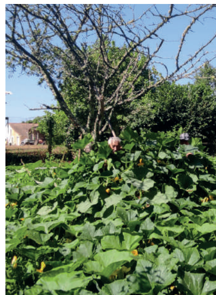
Belle planche pour jardiniers à l'affût !